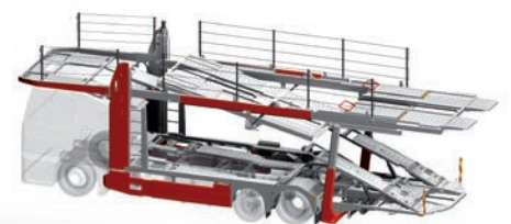
metago® pro M5