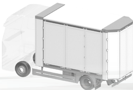
ecomode performance S2-180