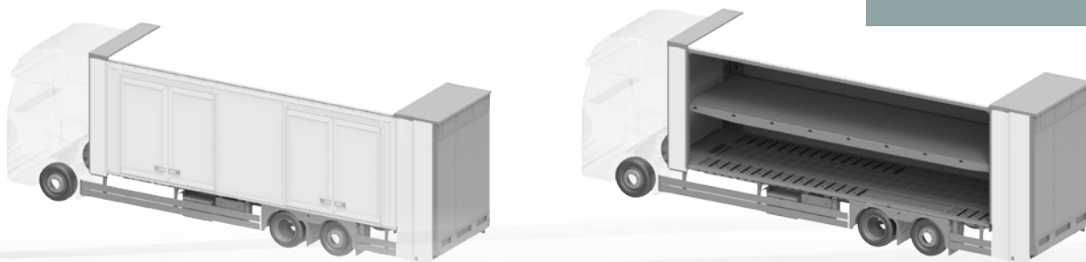
ecomode performance S4-260 L

ecomode performance S1-075 ecomode performance S2-260 ecomode performance S4-260 L