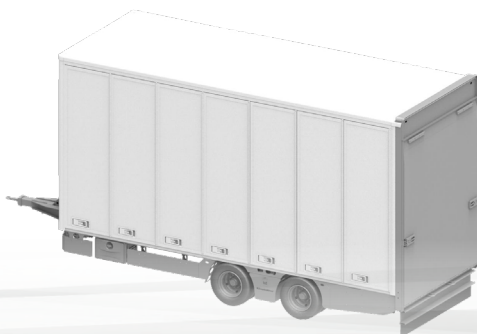
ecomode performance T2-180