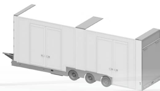
ecomode performance S2-180