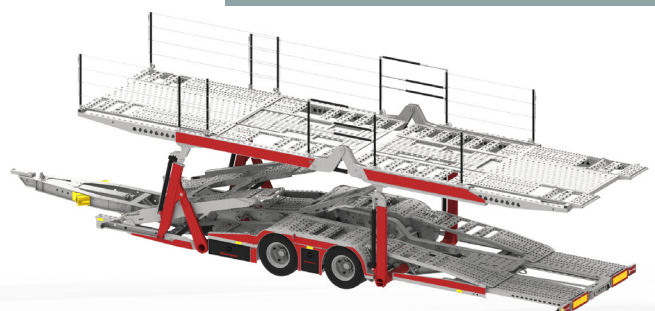
intago® MAX fp