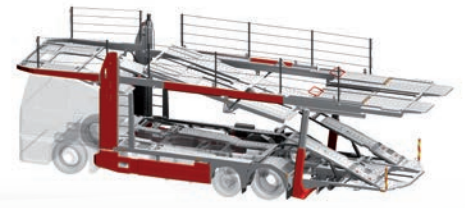
metago® pro M5