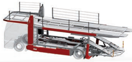
metago® pro M4