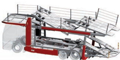
metago® pro M1