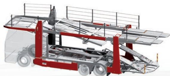
variotrans® pro A5